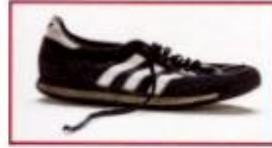
मॅरेथान आफ होप मध्ये धावतांना टेरीचा झिजलेला बूट

लहान लहान मुलांनी नाणी दान केली. लोकांनी टेरीचा उत्साह वाढविला. ऑटारियो प्रदेशातून टेरीची दौंड सुरू होती तेव्हा पूर्ण कॅनडा दौंडीमध्ये सामिल झाला. टेरीच्या मनात आले की प्रत्येक कॅनडिअनने 1 डालर दान केला तरी खूप मदत होईल. त्याने आपल्या भाषणात जाहिर केले की फक्त 1 डालर दान करून तुम्ही "मॅरेथान आफ होप" मध्ये सहभागी होऊ शकाल.