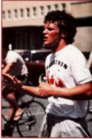
मॅरेथान आफ होप मध्ये धावतांना टेरी लोकांना अभिवादन करीत आहे